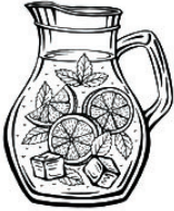
SANGRIA | 1900