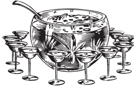
PLANTER'S PUNCH | 2500